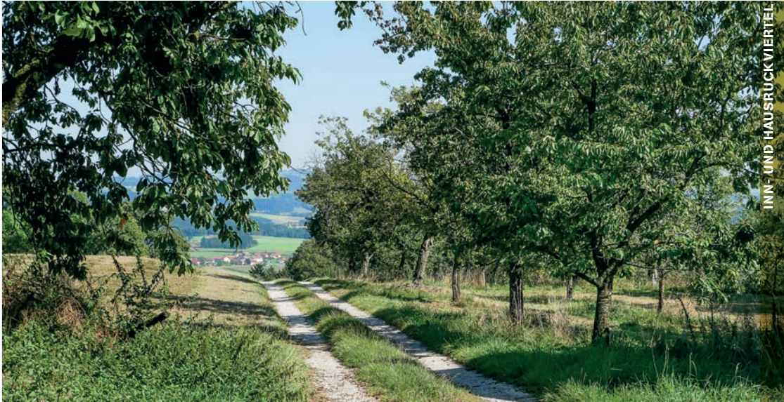
INN- UND HAUSRUCKVIERTEL

EINE RUNDREISE VOM ACKERSTIEFMÜTTERCHEN BIS ZUM ZILPZALP